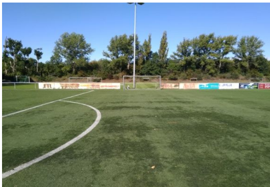
KF KR 3-2-1 GF KR 3-2-2