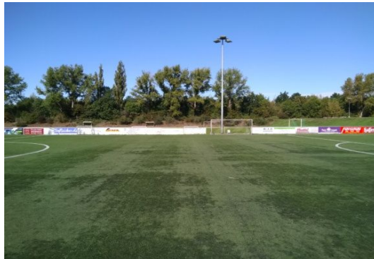
KF KR 3-1-2 GF KR 3-1-2