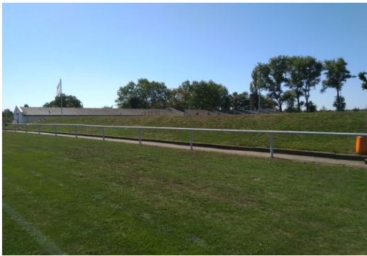
RP 1-1 u RP 1-1 o