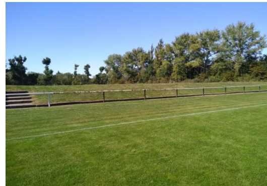
RP 1-4 u RP 1-4 o