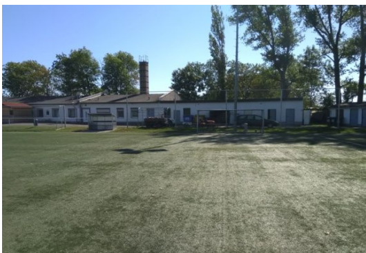
KF KR 3-2-2 GF KR 3-2-1