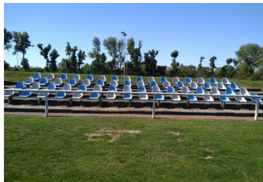
RP 1-3 u (Sitze) RP 1-3 o