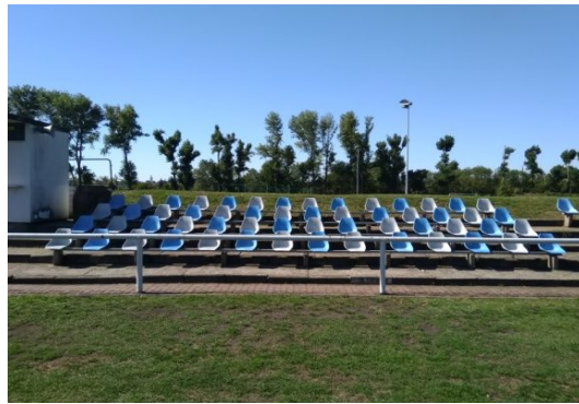
RP 1-2 u (Sitze) RP 1-2 o