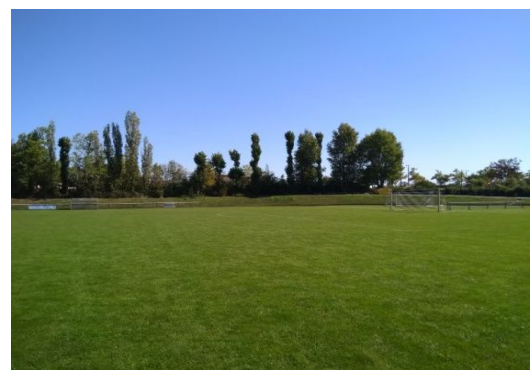
RP 1-6 RP 1-7